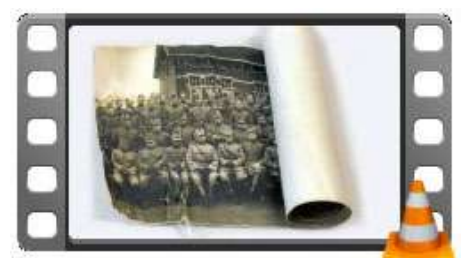
Rouline-foto Hersteld verleden.mp4

Het filmpje draagt de naam ' Hersteld Verleden ' en is gemonteerd op de Artilleriemars van S. van der Poort. U kunt het bekijken door op de afbeelding te klikken.